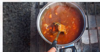
炊事～夕食 宇宙でも食べられた「五島軒」に 負けないカレーづくりに挑戦!