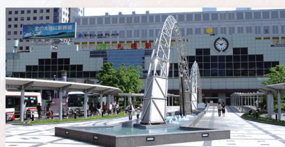
札幌駅 集合 北口バス乗り場へ集合。 遅刻には要注意!

受験生は移動時間もムダにできない!バス移動中は事前課題から問題を出題。 学習内容の定着度の確認や、バスから見える景色の地理や歴史など、 知的好奇心がくすぐられるガイドをファミリー精鋭のプロ教師が行います! 勉強だけでなく、仲間と協力・切磋琢磨するプログラムがもりだくさんの1日です。