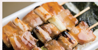
昼食 年間90万食のロングセラー! ハセガワストアの「やきとり弁当」