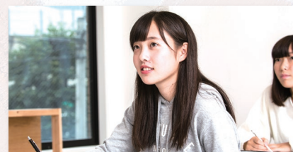
受験集中特訓授業 開始 数学120分・社会60分 3時間の集中特訓(16:00まで)