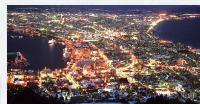
夜景鑑賞 ミシュラン・グリーンガイド・ジャポン 3つ星を獲得した函館山の眺望。